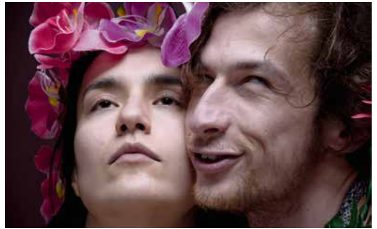
Спектакъл на Метеор и ДНК – Пространство за съвременен танц и пърформанс.

Какво те кара да продължаваш да работиш в