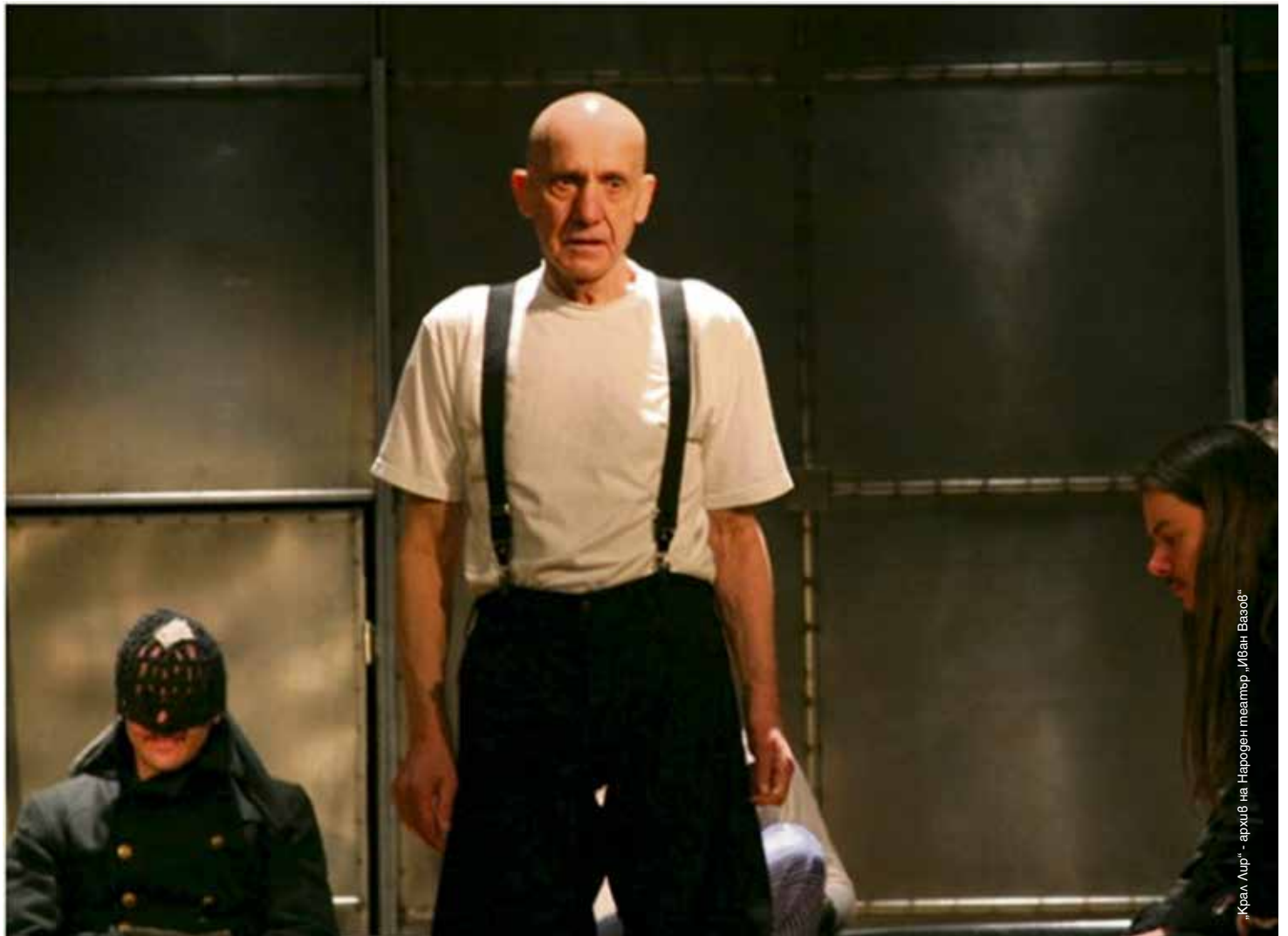
„Крал Лир“